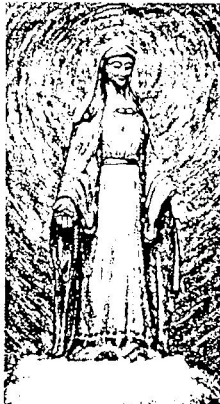
Kraljica Ljubavi u Malom Lošinjju

To su dvije velike Božje tajne u vezi Malog Lošinja. Te velike tajne mi danas nismo u mogućnosti shvatiti svojim razmišljanjem. O tim velikim Božjim tajnama najbolje je u svome srcu nježno prebirati i pustiti da nam Duh Sveti polako govori kroz naše srce.